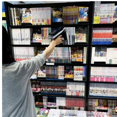
<書棚の商品を RFID ハンディリーダーで読み取る作業イメージ>

※RFID の活用により、出版物の流通状態をタイムリーに把握することを可能とする、PubteX が開発した書籍トレーサビリティシステム。