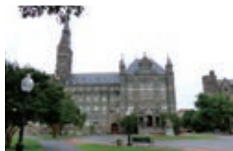
ジョージタウン大学