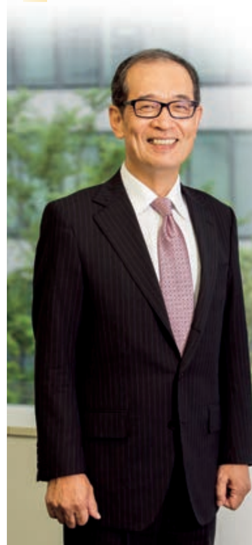
丸善CHIホールディングス株式会社