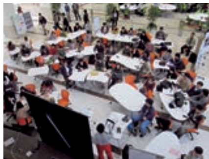
学生の創造性を刺激する講演の様子

丸善株式会社教育・環境ソリューション事業部では大学様ごとの教育目標、要請する人材像に合わせたラーニングコモンズにおける学習活動の内容を企画・立案するラーニングコモンズの活性化を目的としたコンサルティング・プログラムを開発しました。平成25年4月にオープンした関西学院大学アカデミックコモンズ(神戸三田キャンパス)において学生の創造性を掻き立てるプログラムの開発支援、学生スタッフの育成などの業務を大学教員・職員、学生と一体となって実施し、学生の主体的な学びを促す仕組みづくりに取り組んでいます。