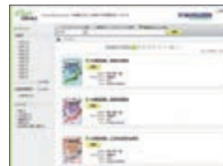
Maruzen eBook Library 一覧表示

大学をはじめとする教育・研究機関を主たる顧客とする丸善株式会社学術情報ソリューション事業部では、理工医学系から人文社会科学系にわたる専門的な学術研究はもとより、学生の基礎的な教養の習得ならびに就職活動などにまで貢献しうる国内刊行タイトルの機関契約型電子書籍サービスMaruzen eBook Libraryを2012年1月末より開始いたしました。紙の書籍を購入いただくのと全く同じ感覚でご希望のタイトルをご契約いただき、機関内のどなたでも自由にご利用いただけるこのサービスは、2013年8月時点で5,000以上のタイトルを擁し、今年度中には累計10,000タイトルの搭載を準備しております。提供タイトルの幅広いラインアップと圧倒的な使いやすさ、契約方法の簡便さによりご好評をいただいている当サービスは、提供開始後1年で200を超える大学その他の教育・研究機関で導入され、さらにそのサービス規模を拡大しています。