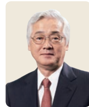
丸善CHIホールディングス株式会社 代表取締役社長

弊社では、「知は社会の礎である」との価値観のもとに、これらの取り組みを進めることにより、出版流通を通じた一層の社会貢献と収益力の向上に努めてまいりまいる所存ですので、株主・投資家の皆さまにおかれましては、引き続きご指導とご鞭撻を賜りたく、お願い申し上げます。