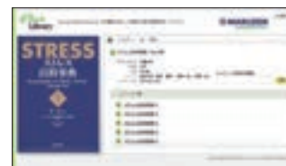
ストレス百科 シリーズ内検索ページ